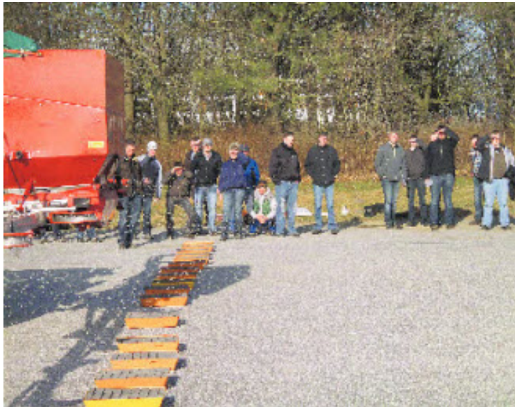
Fachschüler beobachten die erste Testfahrt über den Versuchsstand.

Wenn man bedenkt, dass für einen Ackerbaubetrieb mit einer Fläche von 100 ha etwa 25.000 bis 30.000 € reinen Düngerkosten zu Buche schlagen, drängt sich sofort die Frage auf, wie gut es mit der Streutechnik gelingt, den wertvollen Dünger gleichmäßig auf der Fläche zu verteilen. Die Verteilgenauigkeit drückt sich in dem sogenannten Variationskoeffizienten (VK) aus, der bei sehr guter Verteilung kleiner 5 %, bei guter Verteilung kleiner 10 % und bei befriedigender Verteilung kleiner 15 % sein